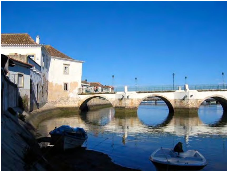
Taviras Wahrzeichen: 2000 Jahre alte Römerbrücke

Erweitern Sie ihr Wissen und ihre malerischen Fähigkeiten in einer grandiosen Umgebung mit viel Kultur in sommerlicher Atmosphäre!